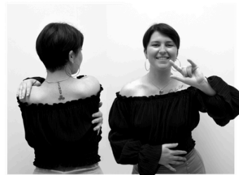
Pour mon frère Eminem "Stan"