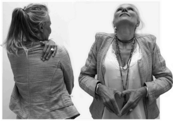
Pour La Vie Phil Wickham "Song in my soul"