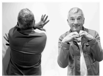
Pour ELB Tina Turner "The Best"