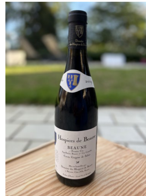
Hospices de Beaune Beaune 1 er Cru Cuvée Guigone de Salins 2019