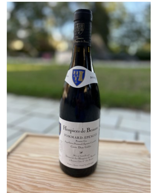
Hospices de Beaune Pommard - Epenots 1 er Cru Cuvée Dom Goblet 2019