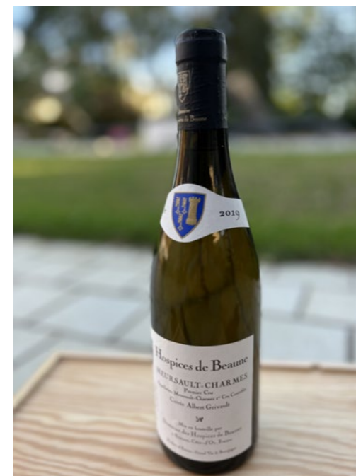
Hospices de Beaune Meursault - Charmes 1 er Cru Cuvée Albert Grivault 2019